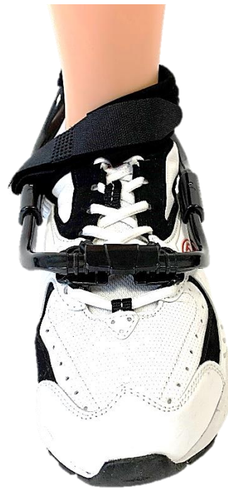
LEFT FOOT PIED GAUCHE