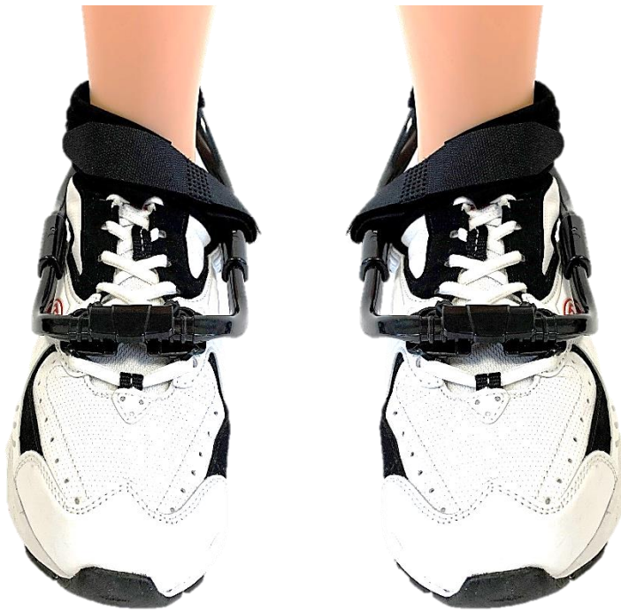
RIGHT FOOT PIED DROIT