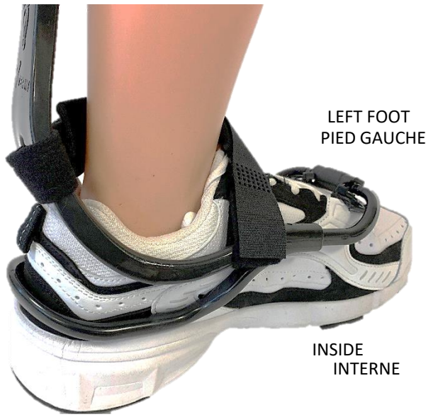
LEFT FOOT PIED GAUCHE